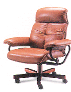
椅子用 Cushion 材

Cosmonate CG-35S はシートクッションフォームの製造に適するように開発された特殊な液状の変性 MDI で、優れた作業性と成形性、高い硬度が要求されるクッションパッドやヘッドレスト、肘掛けの製造などに使用される。特に硬化性を向上させた製品で、乗用車のシートクッション材だけではなく、家具用ソファーまたはイスのクッション材、自転車パッドの製造にも幅広く使用されている。